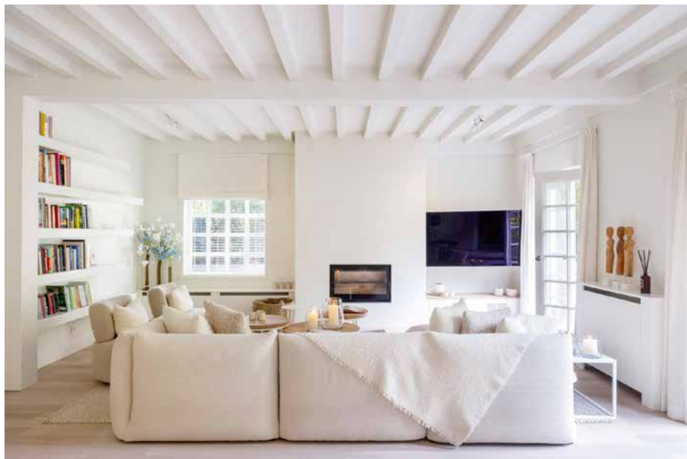
De bank en het wollen vloerkleed zijn op maat gemaakt via Maison Lie. Ook de kunstbloemen, de plaid, de poefjes en de sierkussens van Scapa Home en de vazen van Gommaire komen hiervandaan.

“Ik ervaar hier oprecht elke dag een vakantiegevoel”