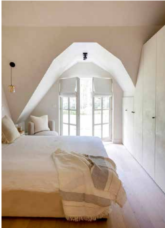
Het bed, bedlinnen en het draaibare stoeltje komen van Scapa Home, de plaid van Libeco Home (alles via Maison Lie).