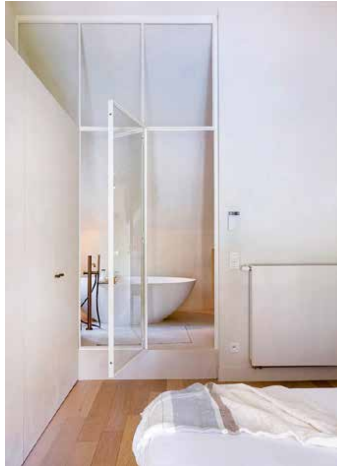
De stalen tussendeur werd op maat gemaakt door Maison Lie.

“In onze woning moet je bovenal een warme indruk krijgen”