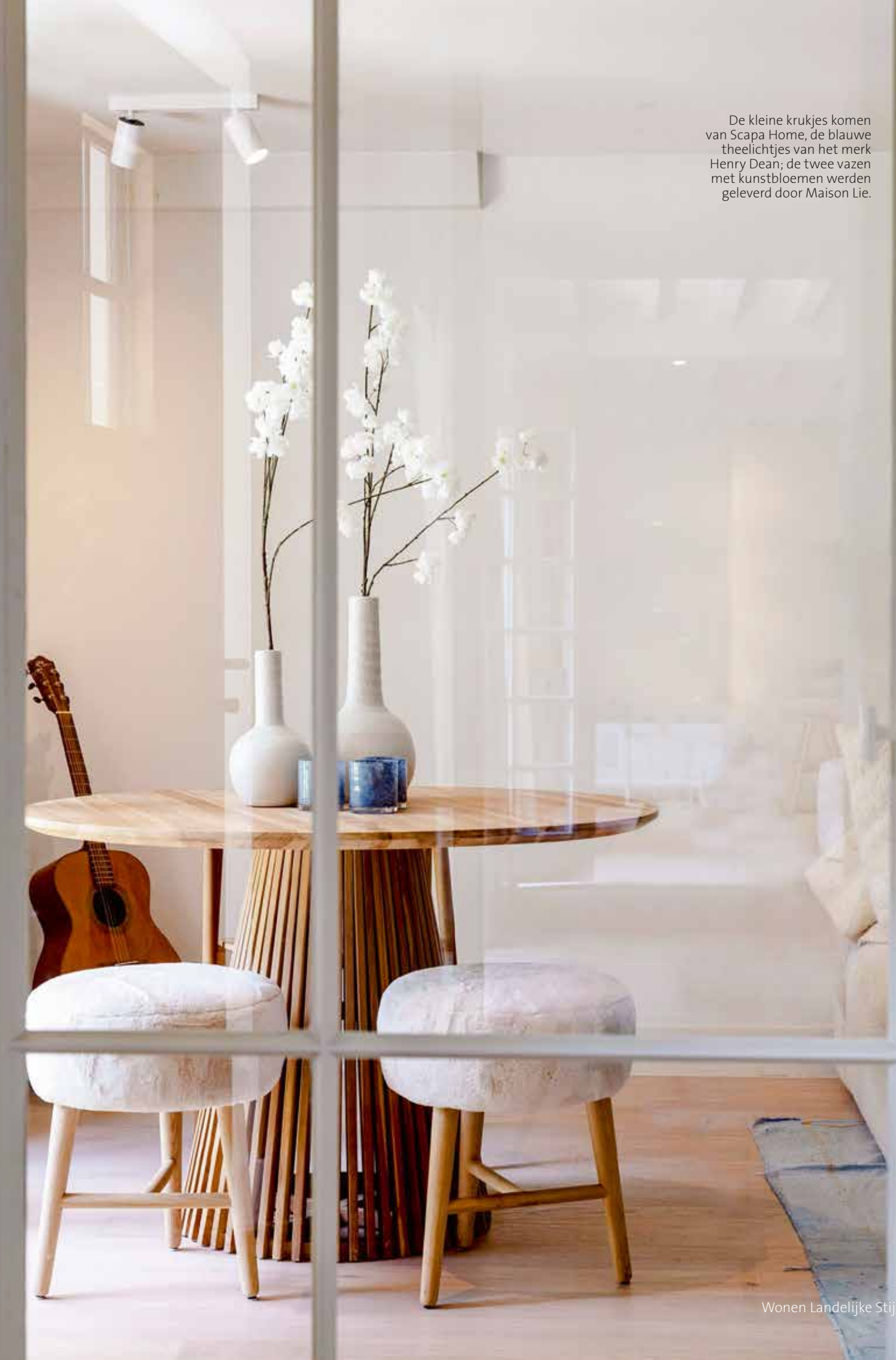
De kleine krukjes komen van Scapa Home, de blauwe theelichtjes van het merk Henry Dean; de twee vazen met kunstbloemen werden geleverd door Maison Lie.