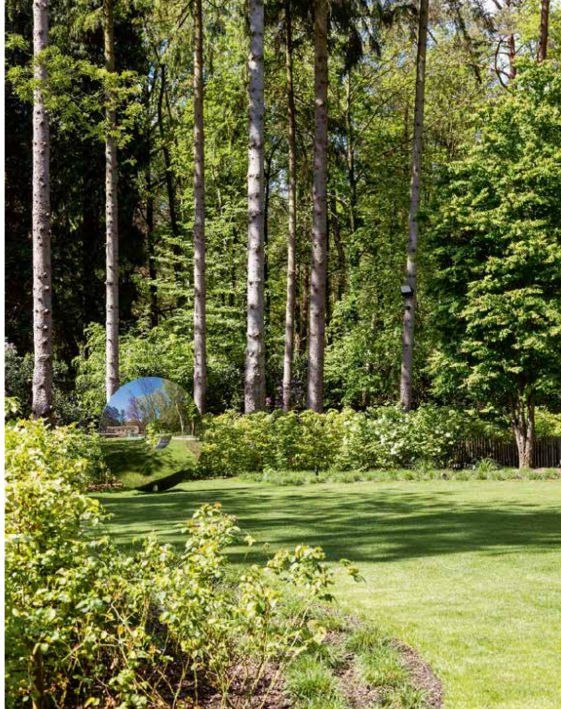
Het spiegelkunstwerk stond al in de vorige woning van Marc en Nathalie. Het is van de Engelse kunstenaar David Harber. In de weerspiegeling ervan zie je steeds iets anders, afhankelijk van het moment en de plaats in de tuin.

het geheel een persoonlijk accent geven. “Wij reizen veel en ik hou ervan om unieke stuks mee te nemen die een plek kunnen krijgen in huis. Zo komt het blauwe tapijt uit de studeerkamer uit Marrakesh. Het past perfect bij de door Maison Lie blauw geschilderde kast. Het schilderij in die ruimte brachten we mee uit Central Park, New York. Aan de groene kruik in de keuken zit ook een leuke herinnering vast, deze is gemaakt tijdens een middag pottenbakken met de kinderen in Cyprus.”